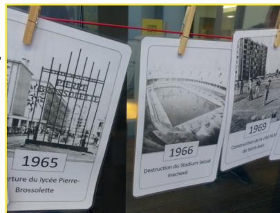
MémoRize © Le Rize

Avec votre classe, explorez la « grande histoire » de Villeurbanne, le temps d'une partie géante de MémoRize . Ce jeu de chronologie, conçu au Rize à partir du fonds iconographique des archives municipales de Villeurbanne, vous permet de vous plonger dans l'histoire de la ville.