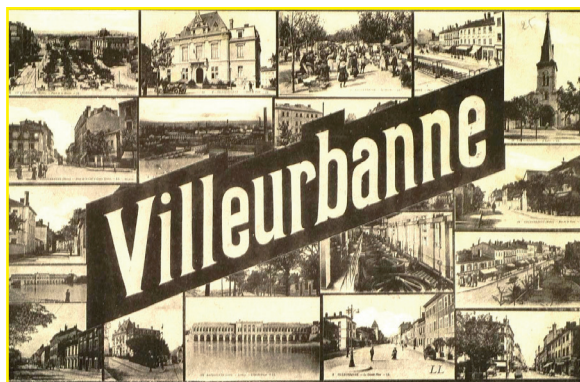
Carte postale

Le Rize explore des thèmes qui prennent leur signification dans l'histoire de la commune, et résonnent encore aujourd'hui à Villeurbanne et ailleurs.